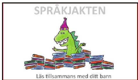
Figur 2 Framsida till vuxenbroschyren

nets tal- och språkutveckling med hjälp av böcker. Broschyren är lättläst med rubriker och bilder och kan skickas med utan genomgång eller användas som samtalsunderlag vid föräldrasamtal.